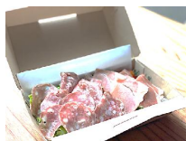
■パルマプロシュートとサラミ

■注文後、出来上がり次第お部屋にお電話いたします。受け取りは3Fレストラン THE PEAKまでお越しください。