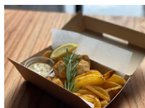
■THE PEAKフィッシュアンドチップス