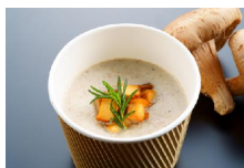
■大分椎茸のポタージュ