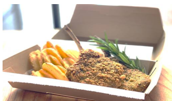
■骨付き仔羊のコトレッタ