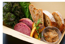
■猪と錦雲豚のリエット