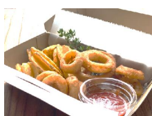
■クリスピーポテト&オニオンリング