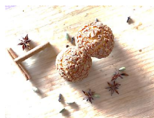
■スパイシークッキーシュー2個