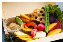
■温野菜のバーニャカウダ